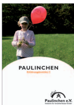
18. Paulinchen – Erfahrungsberichte 2