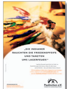
15. Plakat „Indianer“