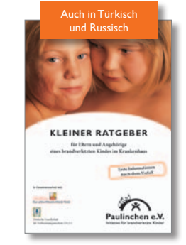
20. Kleiner Ratgeber für Eltern und Angehörige eines brandverletzten Kindes im Krankenhaus