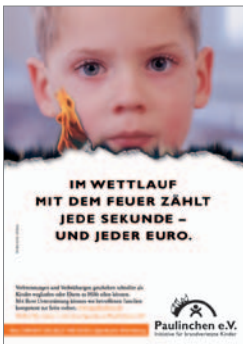
8. Plakat „Junge“