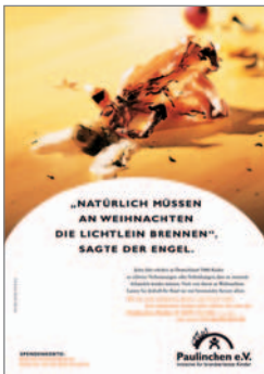
13. Plakat „Engel“