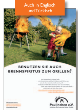
5. Plakat „Grillen“ Deutsch auch in DIN A3 und DIN A4