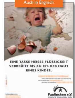
10. Plakat „Verbrühung“ Deutsch auch in DIN A3 und DIN A4